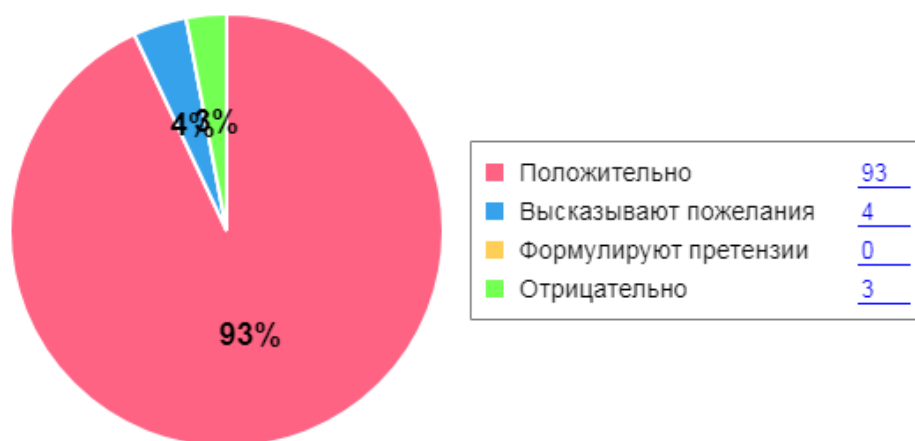
Как родители оценивают детский сад

4.4. Информация СМИ о деятельности детского сада: информация о деятельности периодически публикуется в районной газете «Авангард».